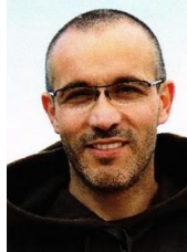
M. André Baechler Assistances

Rte de la Glane 143 b 1752 Villars-Glâne andbae@gmail.com